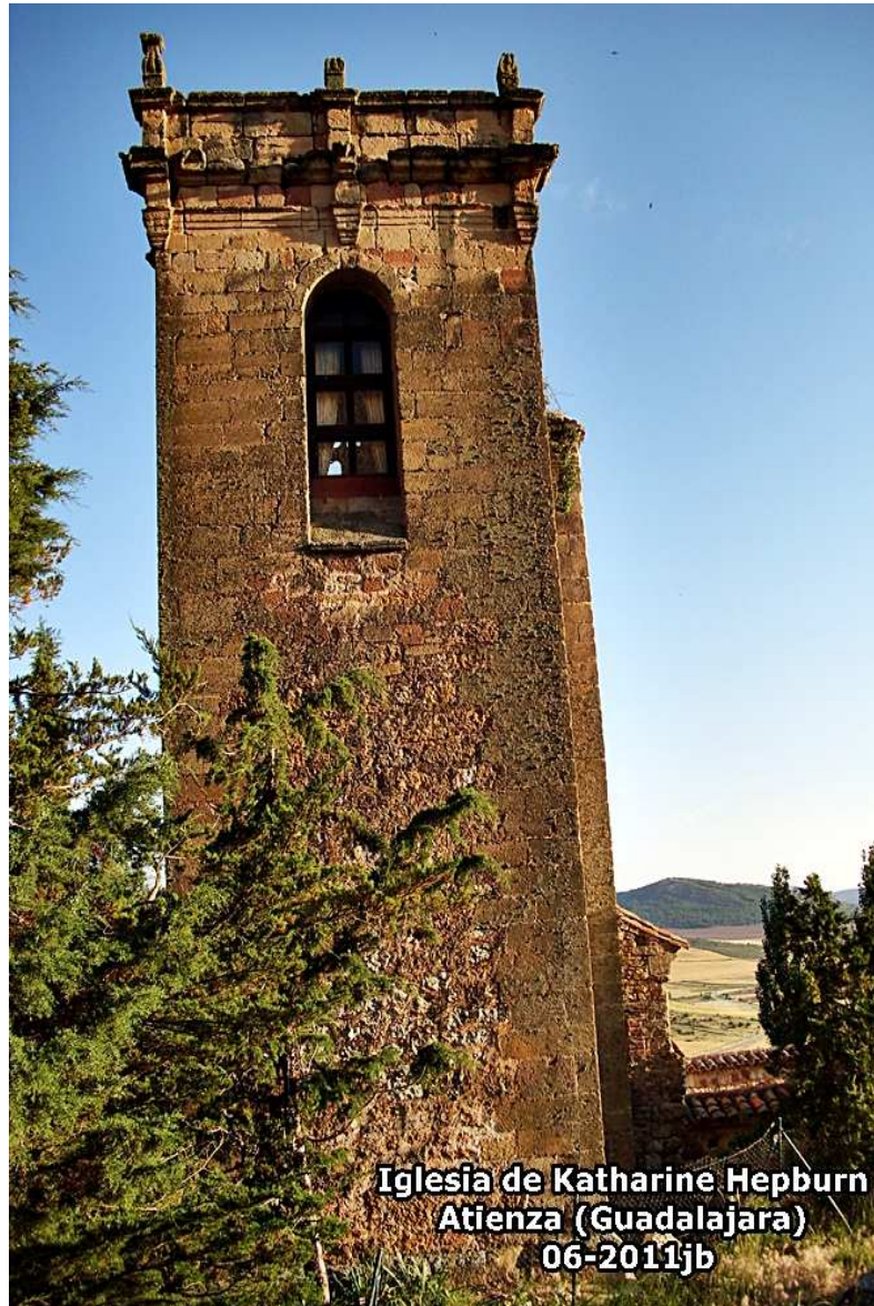
Iglesia de Katharine Hepburn Atienza (Guadalajara)