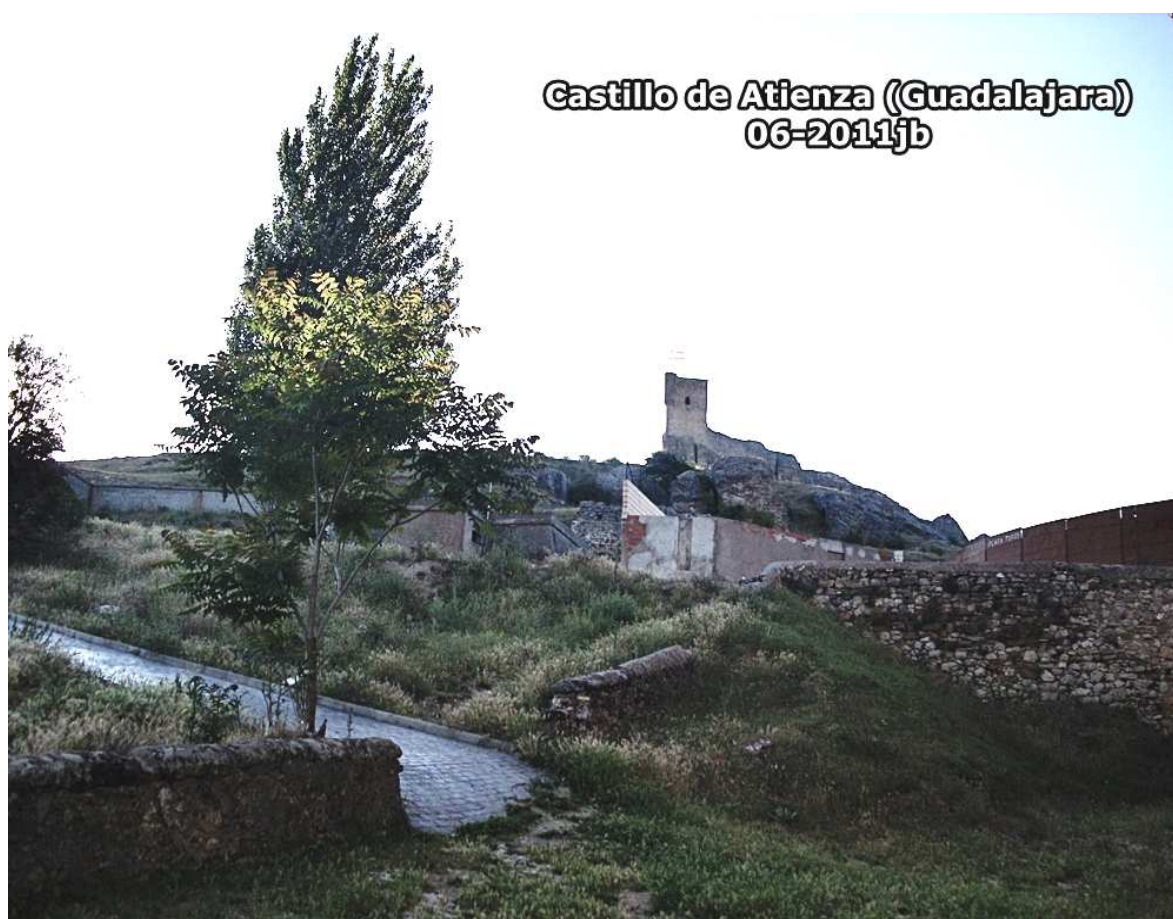
Castillo de Atienza (Guadalajara) 06-2011jb

Atienza es Conjunto Histórico-Artístico desde el año 1962 y está a 1.200 m. de altitud.