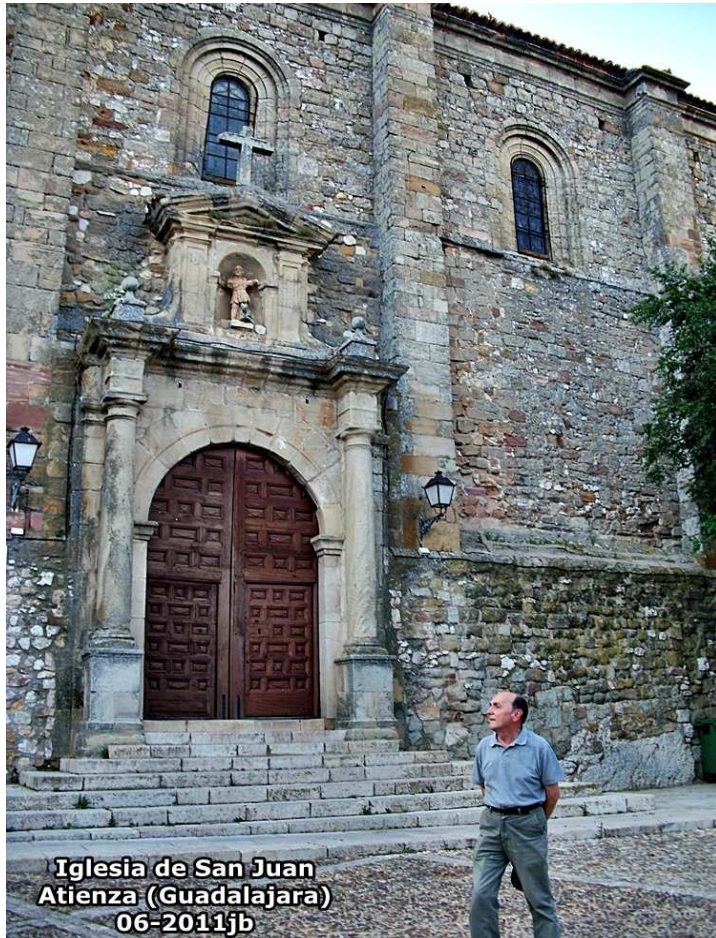
Iglesia de San Juan Atienza (Guadalajara) 06-2011jb

S. XII, renacentista, reconstruida en el S. XVI, está situada en la Plaza del Trigo siendo la parroquia de Atienza, retablo mayor barroco, altar de La Inmaculada del S. XVII. Tiene 3 naves con columnas muy grandes y frescos de Joaquín Soriano.